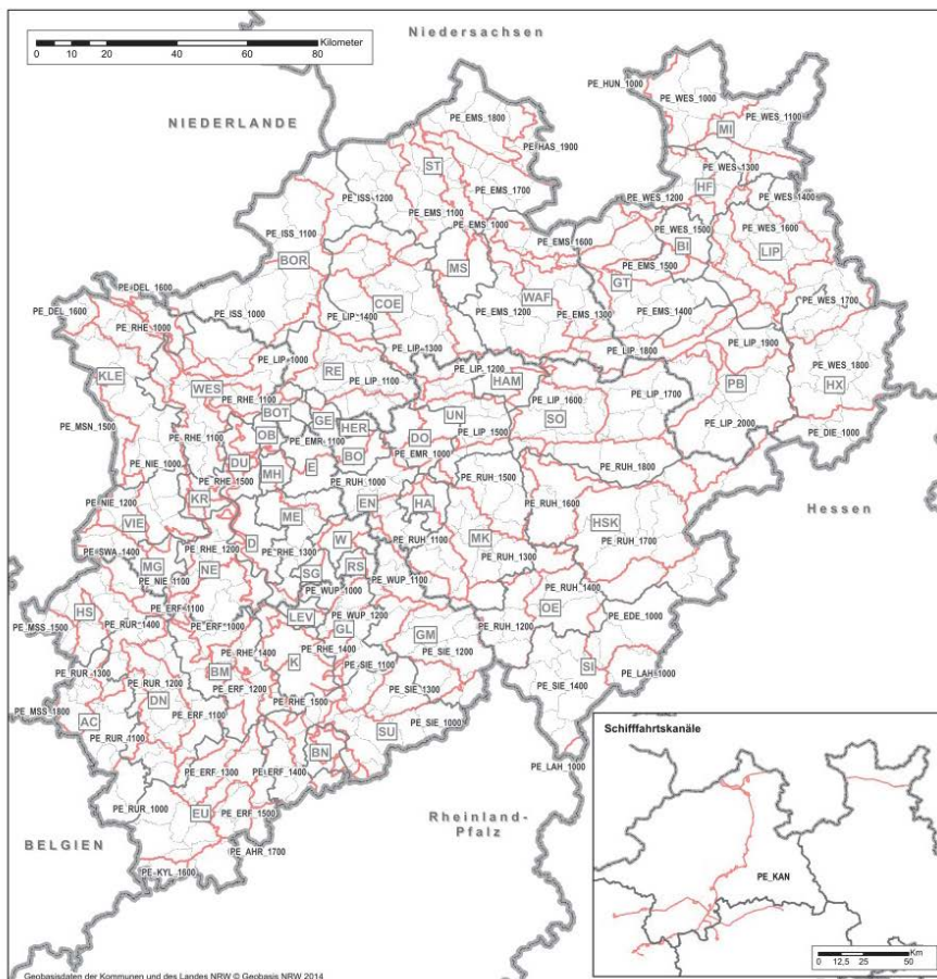
Planungseinheiten und Verwaltungsgrenzen in NRW