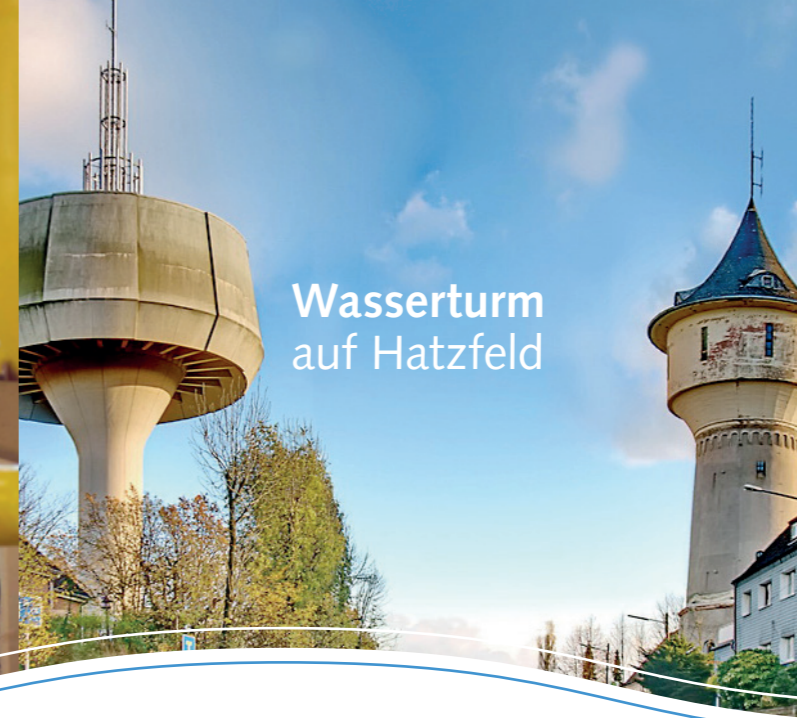
Wasserturm auf Hatzfeld